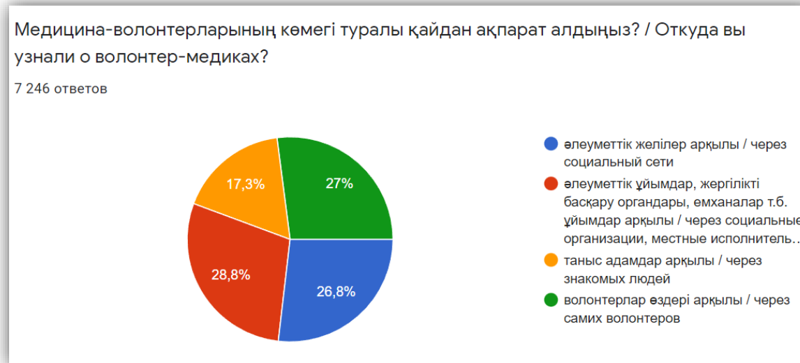
Рисунок 4. Откуда вы узнали о волонтер-медиках.

На данный вопрос мнения бенефициаров разделились в равной мере. 28,8% бенефициаров узнало о проекте через организации здравоохранения и социальные органы, 26,8% через социальные сети и распространяемые буклеты, 27% бенефициаров через непосредственно волонтеров. Также 17,3% подсказали знакомые люди. Это показывает, что необходимо работать по всем имеющимся направлениям по поиску и охвату бенефициаров.