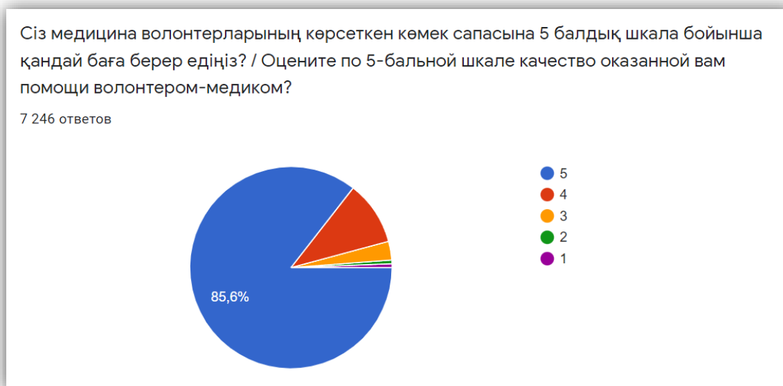
Рисунок 3. Оценка бенефициарами оказанной волонтерской помощи.

Опрос показывает, что 85,6% бенефициаров удовлетворены оказываемой помощью.