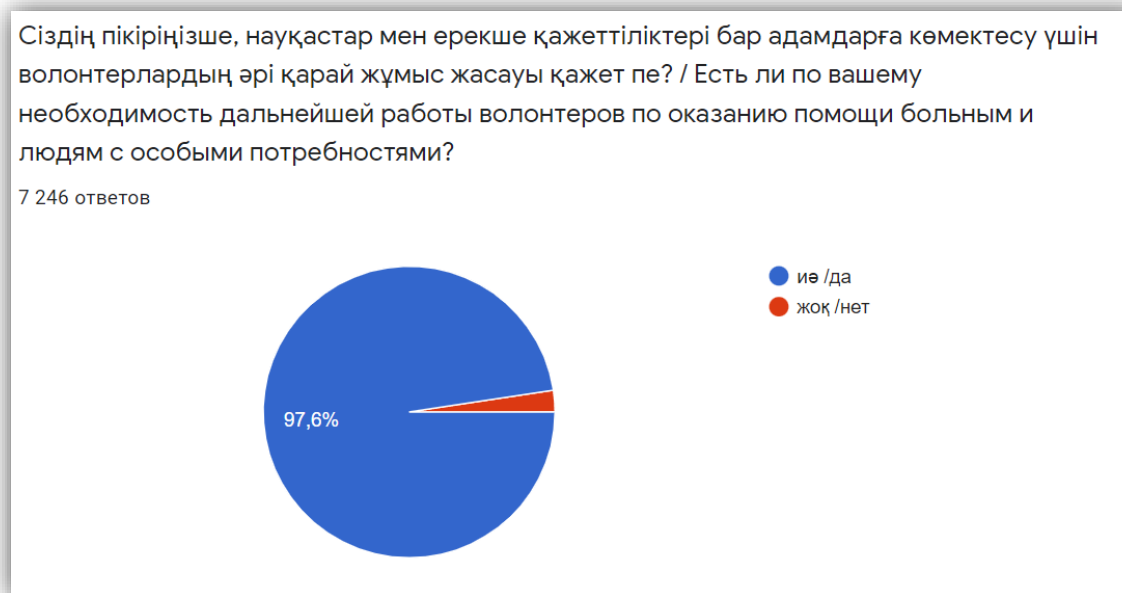
Рисунок 6. Необходимость дальнейшей работы волонтеров.

Данный рисунок наглядно показывает, что бенефициары считают проведение подобных проектов удачными и ждут дальнейшей работы волонтеров.