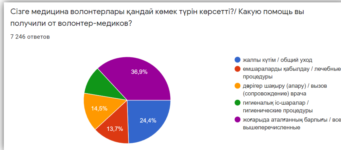
Рисунок 2. Вид помощи волонтера полученная бенефициаром.

Данный график показывает, что 36,9% бенефициаров получили широкий спектр волонтерской помощи, а 24,4% получили общий уход и поддержку. 13,7% и 14,5% бенефициаров получили помощь по лечебным процедурам и сопровождению врачебной помощи.