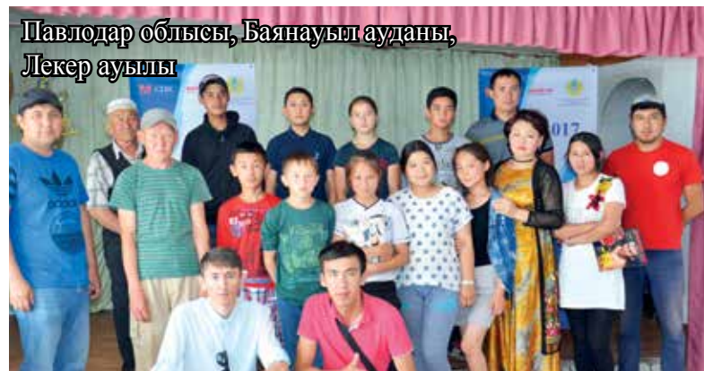
Павлодар облысы, Баянауыл ауданы, Лекер ауылы