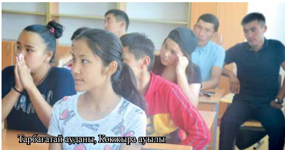
Тарбағатай ауданы, Көкжыра ауылы