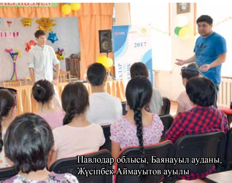
Павлодар облысы, Баянауыл ауданы, Жүсіпбек Аймауытов ауылы

и имеет практическую значимость. Целью данного исследования является оценка отношения детей к предпринимательству. В анкетировании принимают участие 1600 респондентов от 14-18 лет из 14 областей и 2 городов республиканского значения.