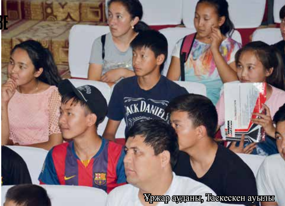
Ұржар ауданы, Таскескен ауылы

Если Вы уже практически приняли решение о развитии своей предпринимательской идеи, то это полдела. Поду-