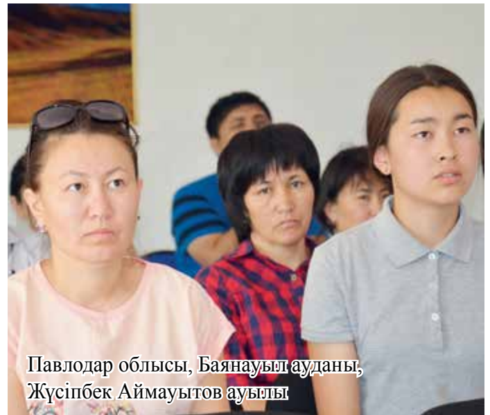
Павлодар облысы, Баянауыл ауданы, Жүсіпбек Аймауытов ауылы

Также МОО «Жастар Үні» по республике проводит два социологических исследования. Первое – это исследование об отношении детей к труду и предпринимательству. В программной статье Президента Республики Казахстан Н.А. Назарбаева «Социальная модернизация Казахстана: двадцать шагов к Обществу Всеобщего Труда» особое внимание уделяется труду как основному фактору развития нашей страны. В связи с этим, данное исследование приобретает особую актуальность