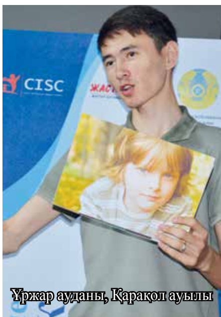
Ұржар ауданы, Қарақол ауылы

этимися качествами сразу, но нужно стремиться к их развитию. Вы должны для себя, насколько обладаете ими, чтобы вести собственное дело.