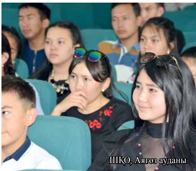
ШҚО, Аягөз ауданы

12 и 15 июня текущего года МОО «Жастар Үні» провели курс по развитию навыков предпринимательства среди учащихся 7 – 10 классов в средней школе поселка Ынтымак Жамбылского района Алматинской области. Для лучшего освоения материала дети по возрастным категориям были разделены на 2 подгруппы. В качестве лектора был приглашен бизнес-тренер