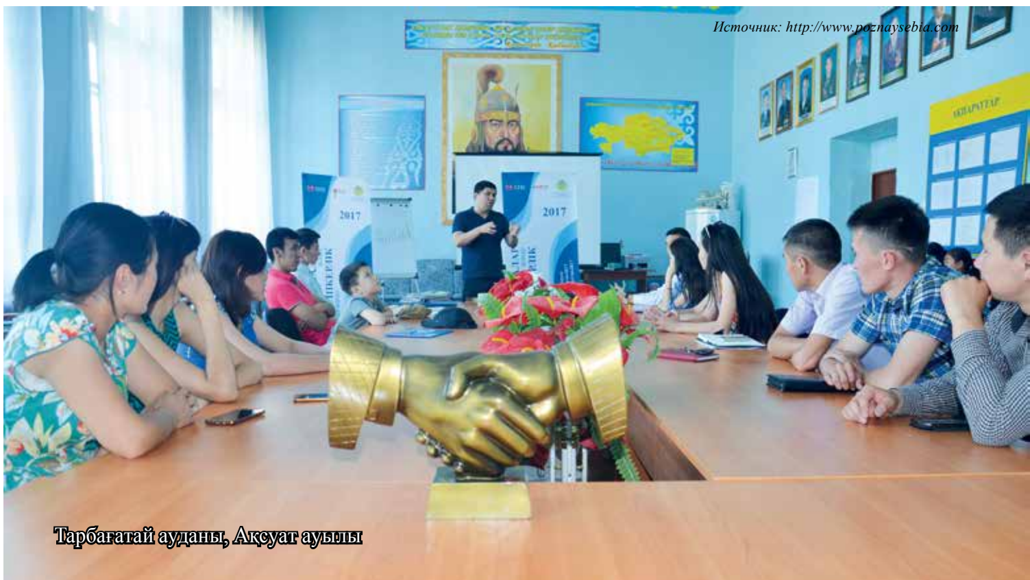
Тарбағатай ауданы, Ақсуат ауылы